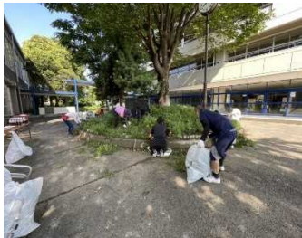
保護者・地域の約80名の方で 除草作業をしました。

「今年の夏は去年より暑いね。」と、毎年、夏になる度、会話に出てきます。過日、テレビの温暖化問題に関する番組で、数年後には、現在の熱中症の危険とされる気温が平常になり、最高気温がそれ以上となってしまうかもしれないという内容を目にし、地球環境・温暖化問題について、本気で考えなければならぬと感じました。