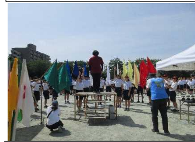
お見事!素晴らしい!選手宣誓