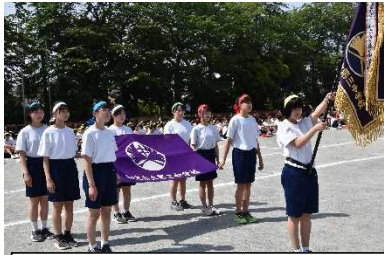
生徒会役員の立派な入場行進

「新時代は この未来だ 世界中全部変えてしまえば ～中略～ 夢を見せるよ 新時代だ」入場曲の力強いフレーズが今も印象深く残っています。(※Ado(アド):女性ボーカリスト「新時代」は映画ONE PIECE FILM REDの挿入歌)