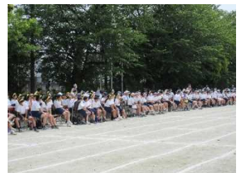
一つになって応援する姿!